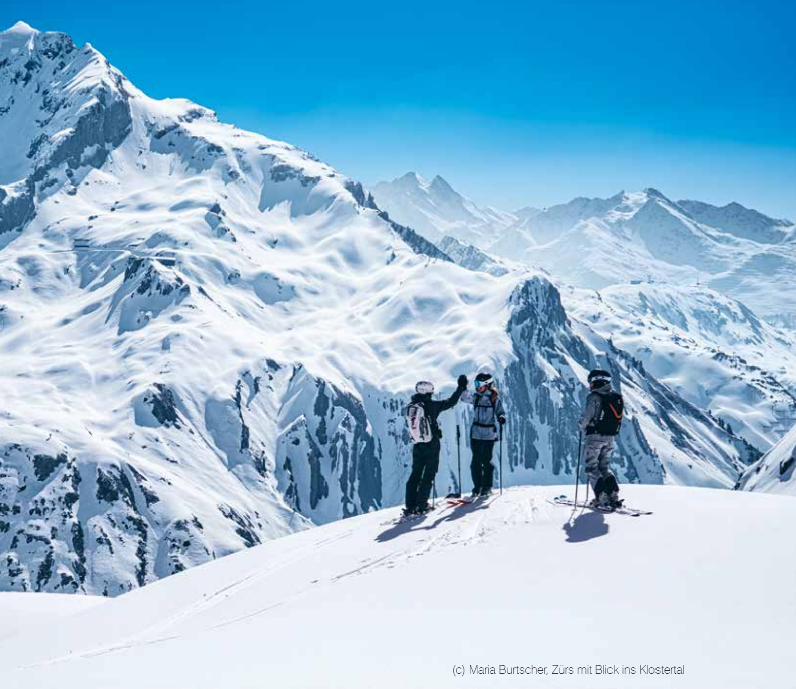
(c) Maria Burtscher, Zürs mit Blick ins Klostertal

Warten wir nicht auf morgen, sondern gestalten wir schon heute unsere Zukunft. Eine Zukunft für unsere Zukunft! Gemeinsam finden wir die richtige Lösung.